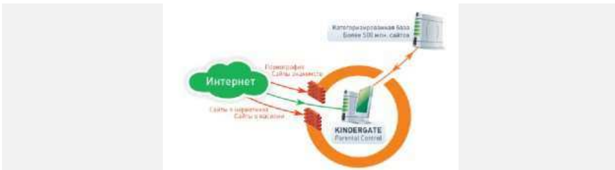
kindergate - родительский контроль